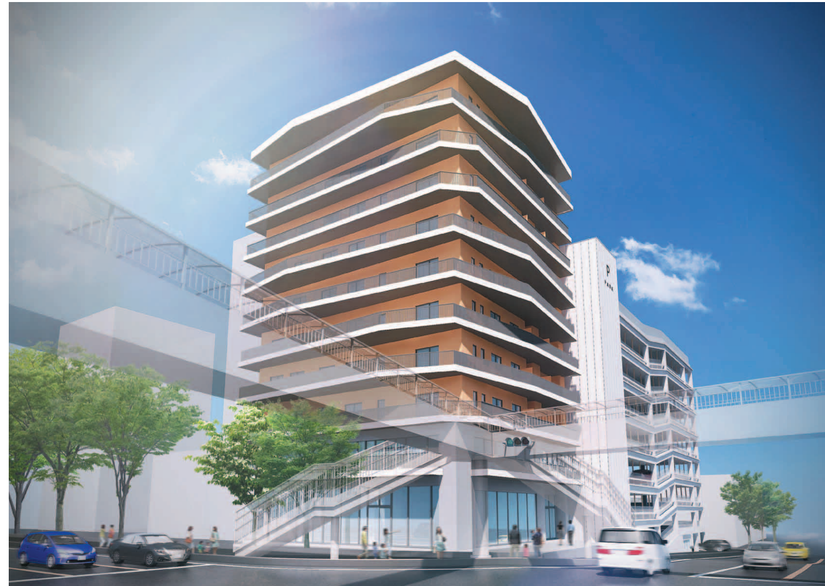
本紙掲載の完成予想CG/平面図/立面図は2018年2月9日時点の計画に基づくイメージ案であり色・形状等については正式に決定したものではありません。また、施工上等の理由により今後変更となる場合がございます。